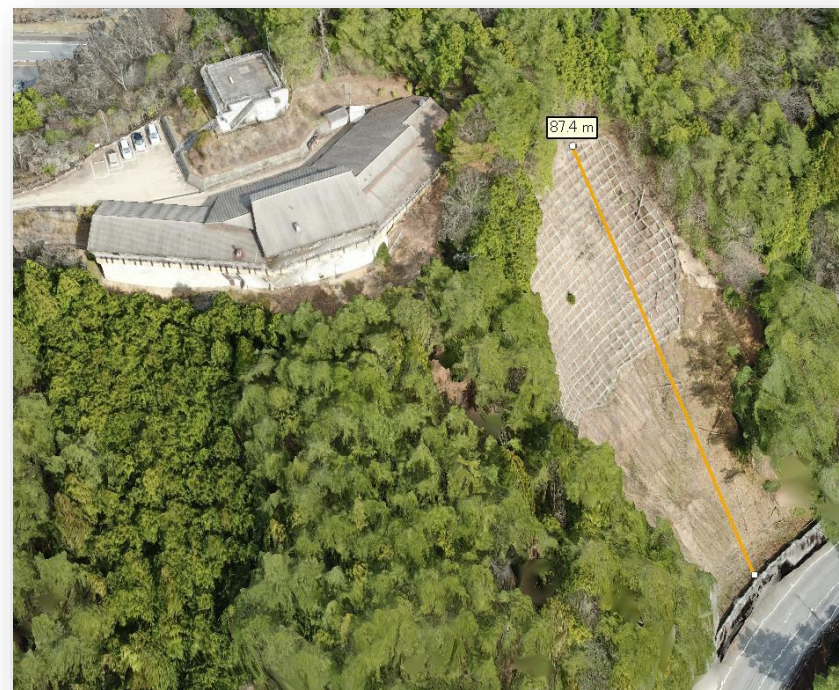
ドローンで取得したデータより、現地にて3Dモデルを生成 (弊社作成)

デジタルツインの作成など道の駅をデータ化することにより、 災害時に迅速な対応が可能